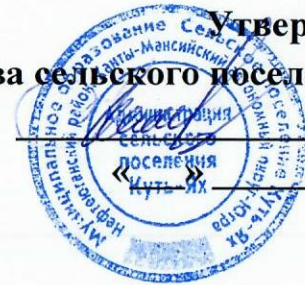
ГРАФИК уборки снега с территории с.п.Куть-Ях на февраль 2022г.

Утверждаю: Глава сельского поселения Куть-Ях Л.В.Жильцова 2022г.